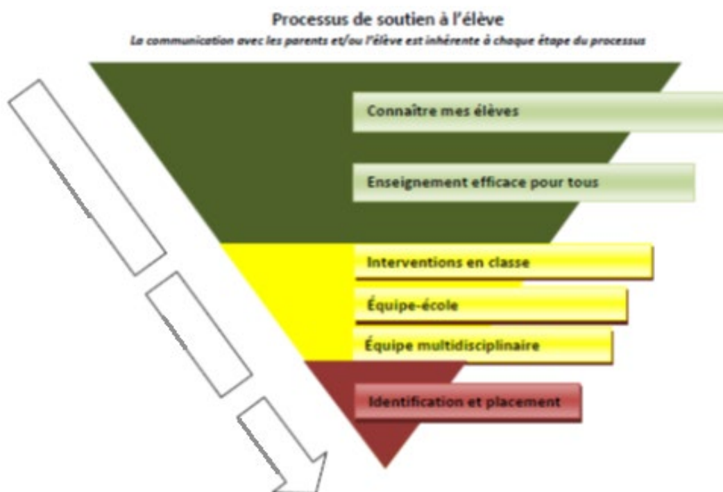
Figure 1 – Processus de soutien à l'élève

Le personnel scolaire du CS Grand Nord suit les étapes du processus de soutien à l'élève dans sa démarche d'enseignement et de soutien à l'élève, (voir figure 1 ci-dessous et section 2.5 du plan). Le processus reflète davantage une démarche d'enseignement efficace dans une philosophie d'apprentissage pour tous et décrit l'étayage nécessaire pour appuyer chaque élève.