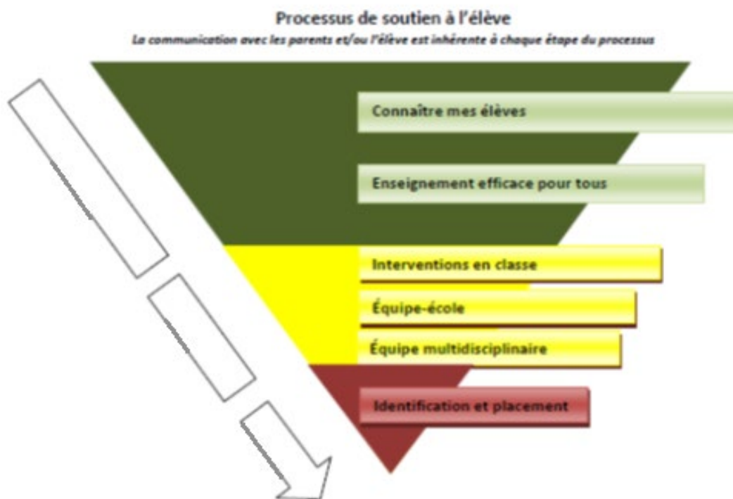
Figure 1 – Processus de soutien à l'élève

Le personnel scolaire du CS Grand Nord suit les étapes du processus de soutien à l'élève dans sa démarche d'enseignement et de soutien à l'élève, (voir figure 1 et section 2.5 du plan). Le processus reflète davantage une démarche d'enseignement efficace dans une philosophie d'apprentissage pour tous et décrit l'étayage nécessaire pour appuyer chaque élève.